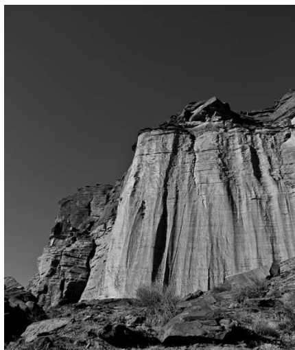
Ilustración 2 1º Imagen Difundida por Federico B. Kirbus del Par. Nac. Talampaya

Su difusión como maravilla natural se debe a Federico B. Kirbus, periodista, escritor, investigador, que a partir de 1977 comenzó publicando artículos ilustrados de las formaciones de Talampaya e Ischigualasto, notas que de esta forma comenzaron a atraer a los primeros turistas independientes.