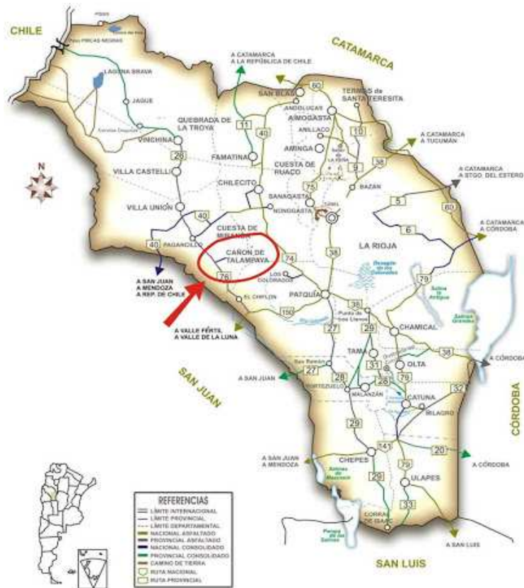
Ilustración 1- Ubicación del Parque Nacional Talampaya

En el mismo, quedó guardada gran parte de la historia geológica de la Tierra acumulado durante millones de años, sus sedimentos quedaron al descubierto al elevarse junto con la cordillera de los Andes.