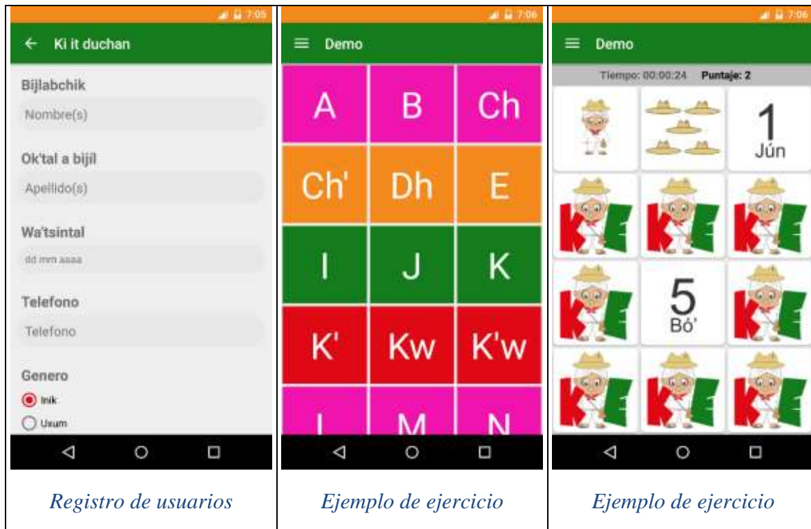
Figura 3. Pantallas de Aplicación Móvil Ka Exla'-VM.