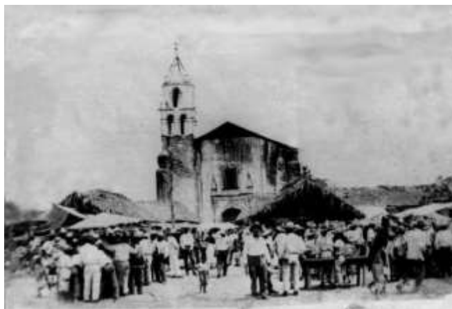
Figura 2: La Parroquia.

Por otro lado, siendo congruente con la arquitectura que predominaba en esa época el templo es renacentista herreriano. La fachada (Figura 2) apunta hacia el sur, encuadrado por un par de sobrias pilastras del mismo estilo posee un arco de medio punto, tiene un ventanal de coral alargado. Al oeste de la portada hay una torre con dos cuerpos, en el primero cuenta con ocho arcos donde se encuentran las campanas y en el segundo sólo cuatro, en la base de cada ángulo tiene una almena cuadrada morisca y rematando está una bóveda conopial que en la cima tiene colocada una banderola de hierro forjado (Meade, 1970).