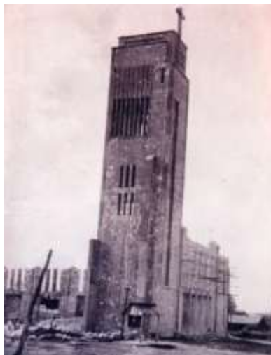
Figura 3: Construcción de Catedral (Torre construida).

Por otro lado, en lo que se refiere a Catedral (Figura 3) Meade dice que el Presbítero Xavier Enrique Guerrero Briones llega a Valles el segundo día de enero de 1934, después del conflicto religioso en la Revolución. Fue él quien trabajó para reestablecer los servicios parroquiales y el arreglo del propio templo, además el sacerdote dio inicio a la edificación del Santuario de Guadalupe que hoy se conoce como la Catedral de la ciudad (Meade, 1970).