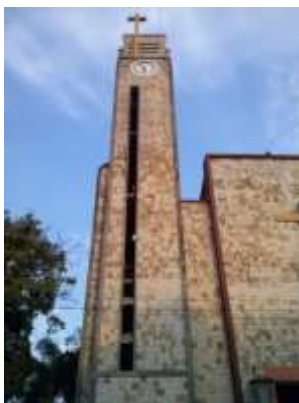
Figura 1: Torre de Catedral.