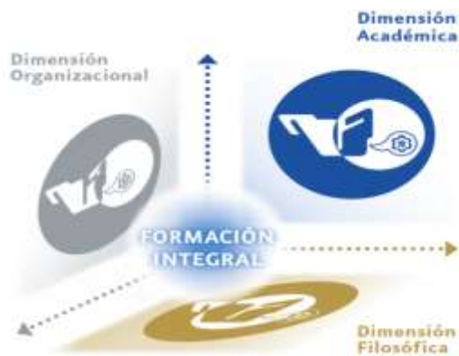
Figura 1 Dimensionamiento del Modelo Educativo para el Siglo XXI: Formación Integral del estudiante

En la figura siguiente se representa, de manera esquemática, el dimensionamiento del Modelo, para valorar la integración filosófica, académica y organizacional en su fin esencial: la formación integral del estudiante.