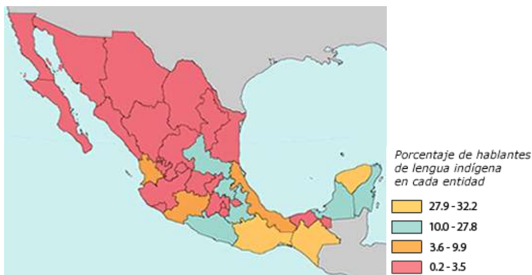
Figura 1. Porcentaje de población de 3 y más años hablante de lengua indígena, por entidad federativa