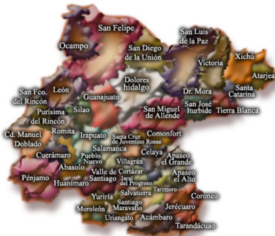
MAPA 1: DIVISIÓN POLÍTICA DE LA ENTIDAD DE GUANAJUATO