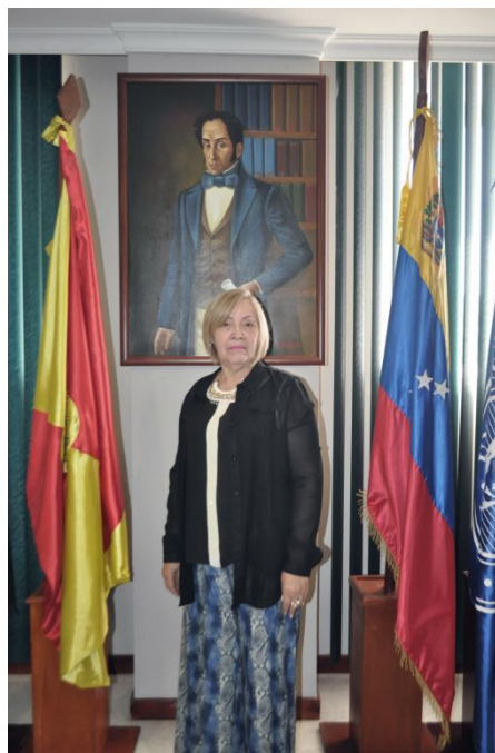
Foto tomada en el interior de la UBA.

No obstante, mi Trabajo de Grado lo hice en orientación del aprendizaje de la Química de tercer año de bachillerato, pero una concepción obviamente más flexible, humanística, en el tránsito entre la pedagogía y la andrología. Pero lo más importante fue que hice mi primer libro, que ni siquiera recordaba acerca de la nomenclatura química, que prácticamente era otro trabajo, de hecho lo presente como un anexo.