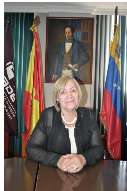
Foto tomada en el interior de la UBA.

(Redacción de la REEA) __ ¿Qué paradigmas humanos y científicos cree que le han configurado como investigadora y por qué?