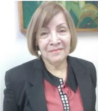
Foto de la ficha del currículum de membresía en el CESPE.