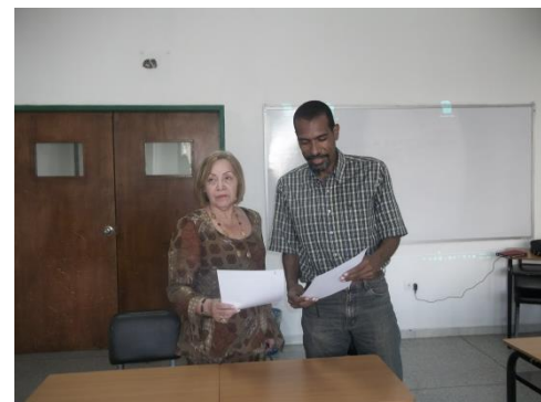
Foto tomada en el momento de firma del convenio REDID-CESPE y ESCRIBA-CESPE.

Es así mismo una alternativa que puede contribuir al mejoramiento de la formación científica de los académicos de la región, iniciando la transformación de las cuestiones planteadas en la pregunta anterior. Igualmente, de afianzar la divulgación internacional y nacional de la investigación transcompleja y particularmente del Enfoque Integrador Transcomplejo, así como los propósitos de CESPE que no están desligado de tales propósitos. Son innegables los logros de tipo académicos que se podrían alcanzar.