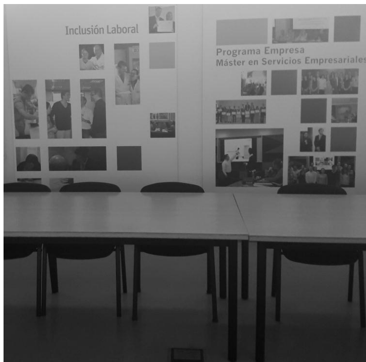
Foto del programa de inclusión laboral y educación de postgrado promovido por PRODIS.