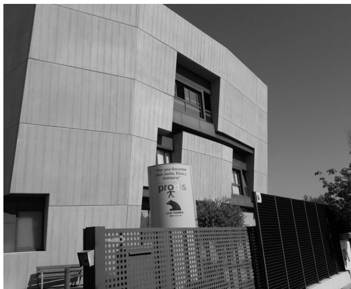
Fachada de PRODIS.

El modelo de PRODIS que integra otra fundación denominada OTIS, hace un proceso de acompañamiento a los estudiantes con discapacidad intelectual en toda la educación general. Posteriormente bajo la premisa de “aprovechar lo que pueden hacer las personas, y no concentrarse en lo que no pueden hacer” los insertan en programas de formación técnica o universitaria para con la ayuda de tutores en este nivel y luego en las empresas donde se asignan, se insertan a partir de una inclusión educativa long-life learning a una sociedad de la que son parte. Este modelo puede verse visualizado en explicaciones del actual director de PRODIS en las siguientes fotografías. En las mismas se ve al fondo de cada fotografía los momentos por los que transita el estudiante, destacando los momentos universitarios.