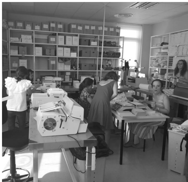
Muestra de los talleres de inclusión laboral de PRODIS. Fuente: fotografía aportada como colaboración de CESPE. (2018).