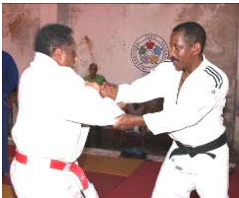
Demostrando como “romper” el control del adversario