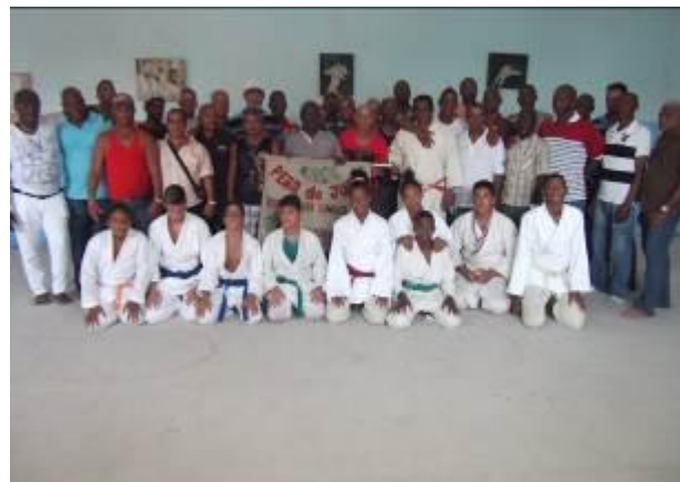
El campeón junto a compañeros y amigos de sus inicios en el Judo y parte de la nueva generación de incipientes campeones del Judo guanajayense