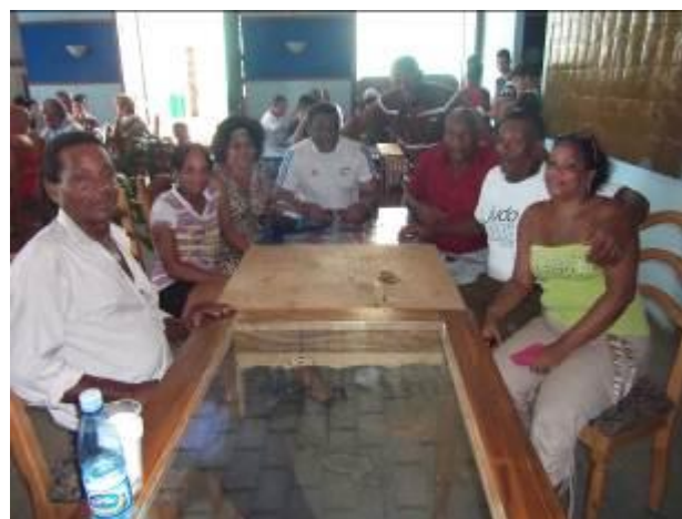
Al centro, compartiendo con parte de sus familiares en el homenaje organizado en Guanajay, por el Día del Judo Cubano, el 30 de julio de 2014