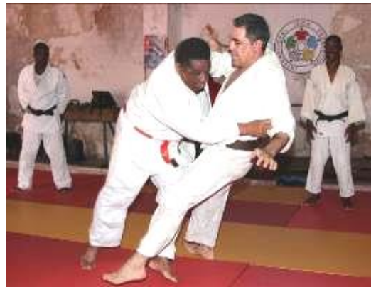
Ejecutando con maestría una técnica de piernas ( kouchi gake )