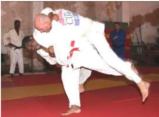
El campeón demostrando la ejecución del uchi mata , la técnica que le dio tantos triunfos