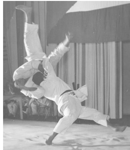
Fotos nos. 5 y 6: Dos técnicas ejecutadas por Federico Guardia: una técnica de hombro ( seoi nage ) y una de sacrificio ( ura nage ).