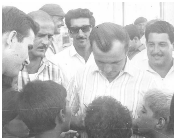
Foto no. 7: Federico Guardia (derecha) junto al célebre cosmonauta soviético Yuri Alexéievich Gagarin, primer hombre en volar al cosmos, durante su visita a Cuba en 1961.