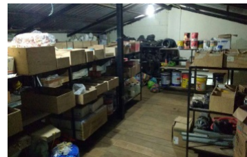
Imágenes de la Empresa EXPORTADORA AURÍFERA S.A.