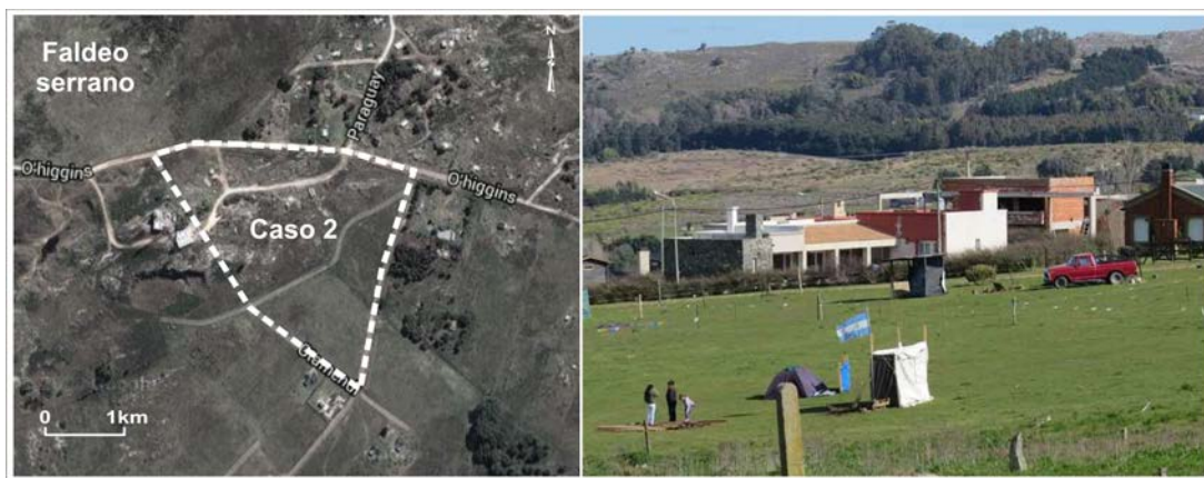
Figura 2. Vista de la zona bajo conflicto: Caso 2.