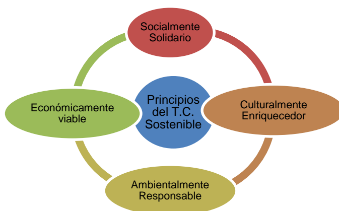
Figura 4: PRINCIPIOS DEL TURISMO COMUNITARIO SOSTENIBLE