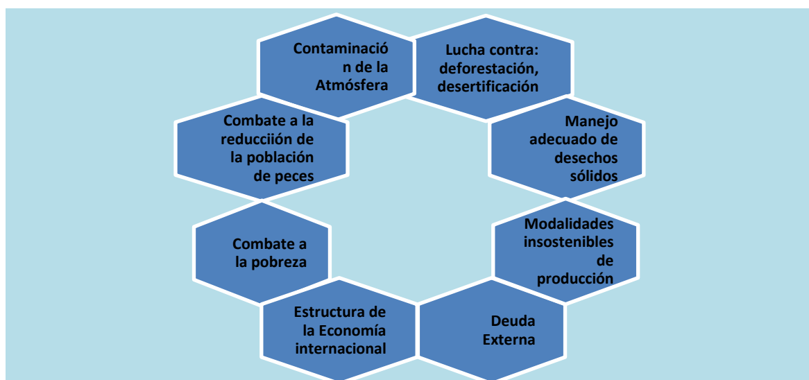
Figura 1: PROGRAMA 21. PLAN MUNDIAL PARA EL DESARROLLO SOSTENIBLE

Por su parte en la sesión de la Cumbre sobre Desarrollo Sostenible en Johannesburgo define al desarrollo sustentable como: “Atender las necesidades actuales sin sacrificar la capacidad de las generaciones futuras para satisfacer las suyas”. (Cumbre Johannesburgo, 2002)