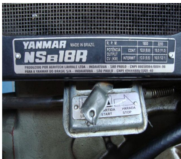
Figura 3: Potência do motor Diesel e tanques de combustível.

Os resultados dessa operação não produz modificações significativas, de vibração, de ruído, de potências, a exceção está nos gases de escape que tem aroma característico de babaçu e as emissões são isentas de SOx e metais pesados.