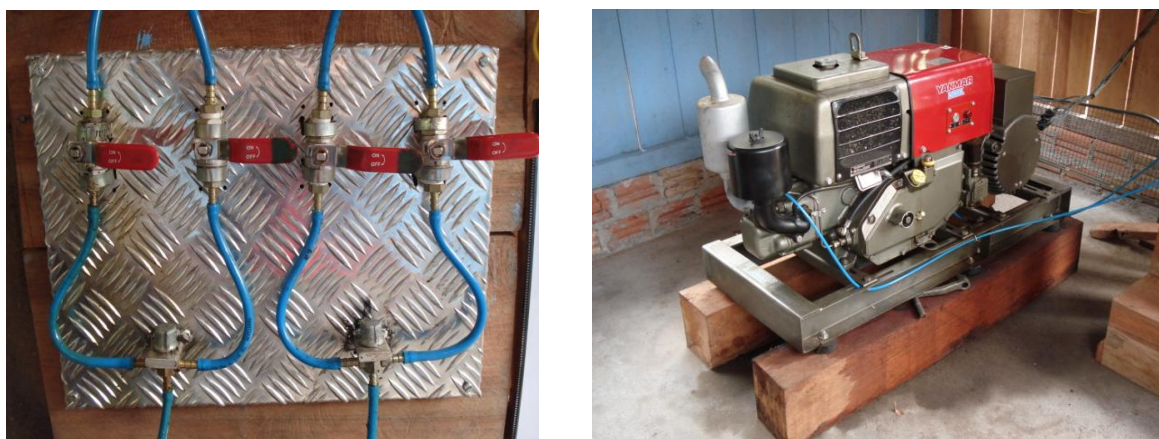
Figura 4: Sistema de troca de combustível e motor ciclo Diesel