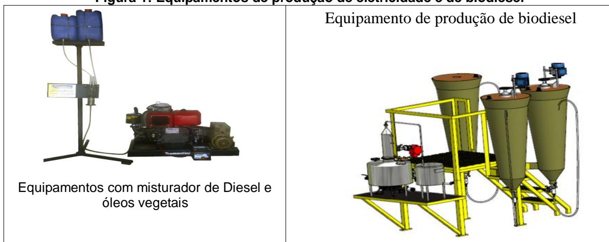
Figura 1: Equipamentos de produção de eletricidade e de biodiesel

O esquema descrito na figura 1 é utilizado para a geração de eletricidade no Laboratório do Grupo de Pesquisa Energia Renovável Sustentável (GPERS), tendo sido construído com equipamentos adequados e de baixo custo, dois tanques de combustível, um rotâmetro hospitalar para medir o fluxo dos dois combustíveis e um misturador composto de dois copos de vidro e limalha de ferro.