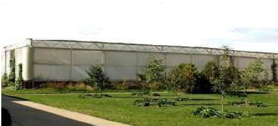
Foto nº1: Secador solar de plantas medicinales con cubierta de polietileno instalado en la finca “La República” del MINAGRI, Cuba.