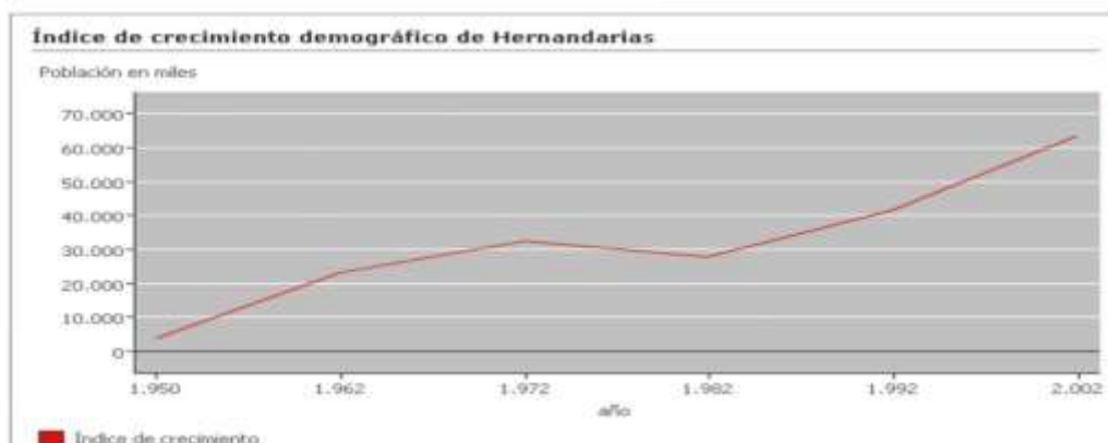
Grafico 2 Índice de crecimiento demográfico de Hernandarias 1950-2002

1980, lo cual, se sitúa al Norte de Ciudad del Este, a unos 14 kilómetros, con una superficie de 5.668 km 2 . A continuación se muestra la evolución demográfica del municipio.