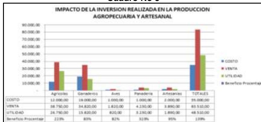
Cuadro No 5

Al finalizar el ciclo de producción y comercialización de sus productos, se procedió a efectuar la correspondiente evaluación de impactos: