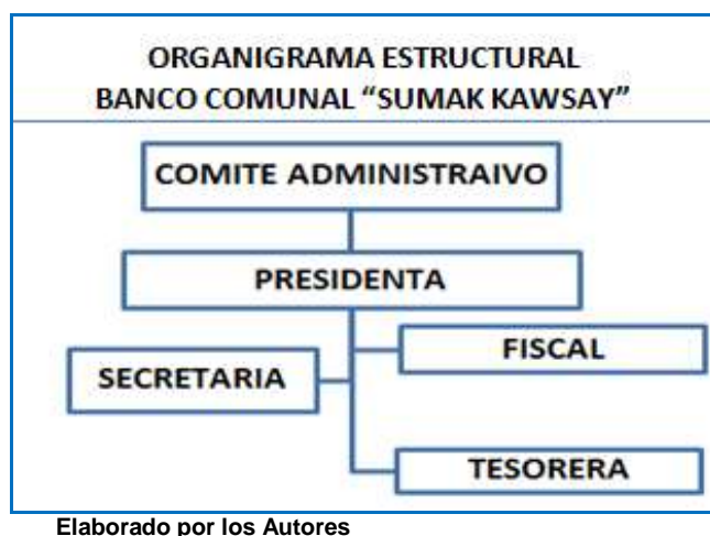
CUADRO No 3

La descripción de funciones del personal del Banco Comunal son las siguientes: