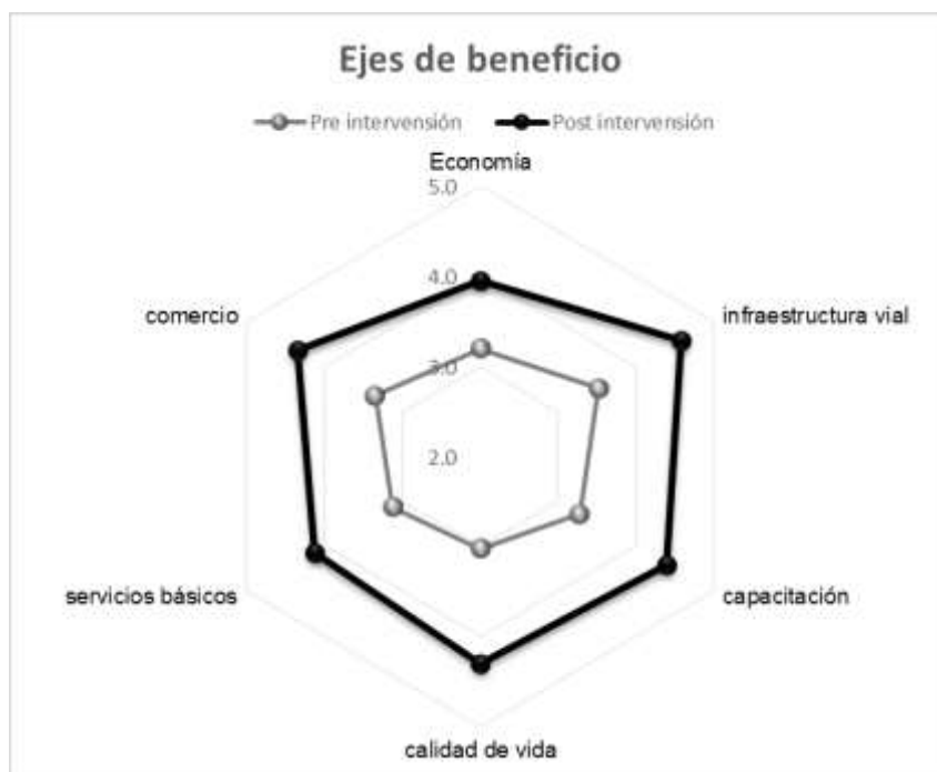
Figura 2. Comparativo de ejes de los beneficios

En la Figura 2 se analiza el valor de los ejes que resumen el beneficio del turismo agrícola, donde resalta la calidad de vida, seguido por el mejoramiento de la infraestructura vial y capacitación, esto indica que las condiciones de vida de la población han mejorado por la intervención en el turismo de los caseríos de la provincia de Tungurahua.