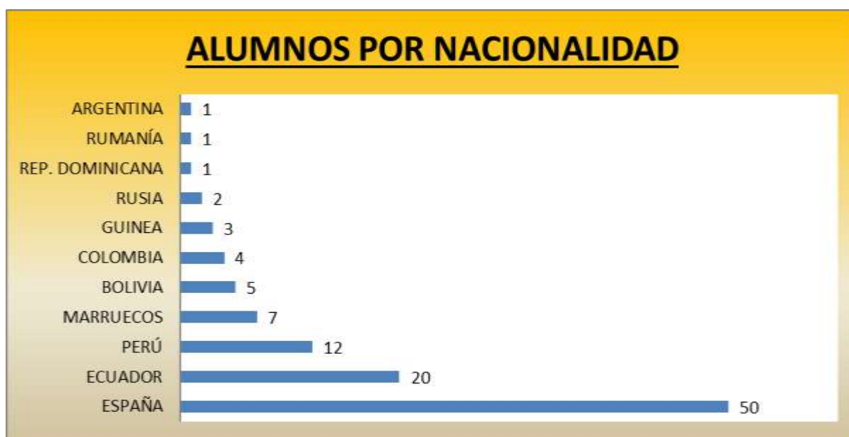
Gráfica 1: Alumnos por nacionalidad. Elaboración propia.