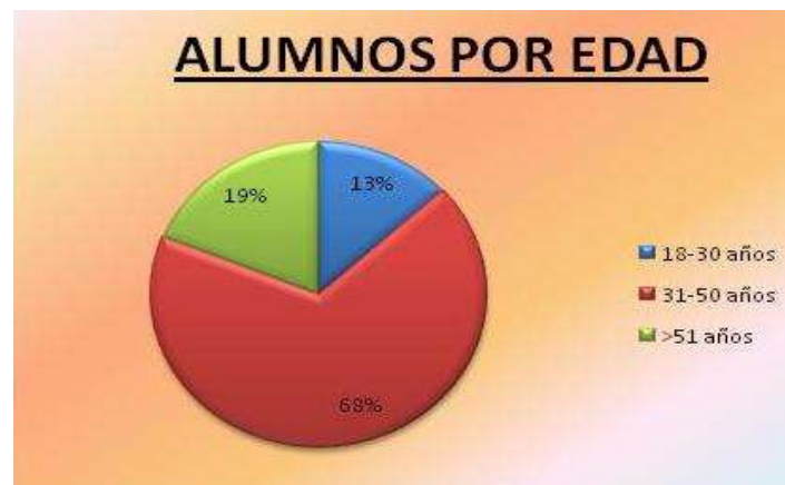
Gráfica 4: Alumnos por edad. Elaboración propia