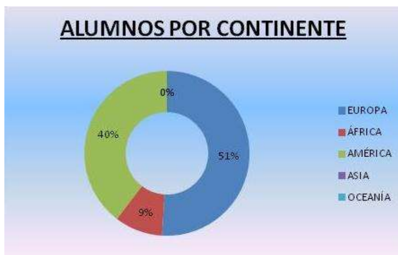
Gráfica 2: Alumnos por continente. Elaboración propia