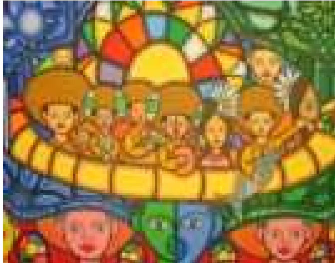
Señales de Vida, del pintor

Fríos: son los colores que van a dar la sensación de pasividad, calma, distancia azul verde