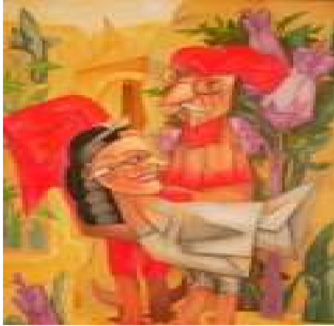
La semilla por dentro

Es una de las obras de la exposición colectiva. La muestra consta de obras de veinte artistas que forman parte del proyecto homónimo del Consejo provincial de las Artes Plásticas cuyo principal objetivo es mantener ligados a su ciudad natal a una serie de artistas plásticos santiagueros que alguno de ellos desempeñan mayormente en La Habana.