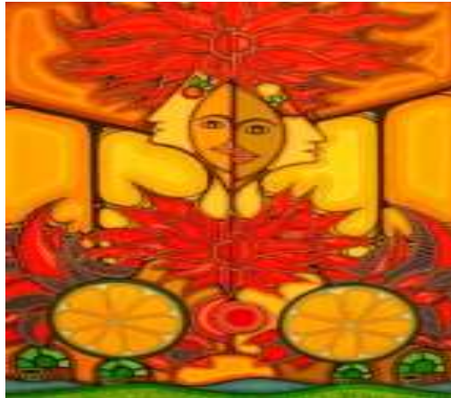
Obra del pintor Roberto guerra

2.- Equilibrio Es la compensación de todos los elementos y atracciones ópticas en las distintas áreas o partes del formato, es la compensación equilibrada de los objetos en toda el área de la obra, tiene varias formas, dentro de ellos están simétrico, asimétrico, simetría radial: