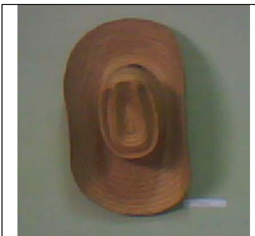
Elemento de la Cultura material campesina.