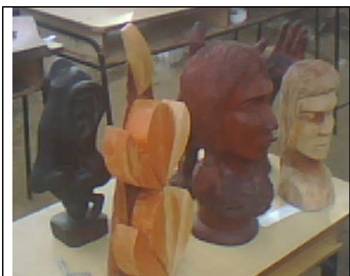
Exposición de Artesanía.