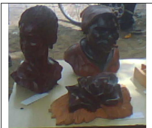
Muestra de Artesanía.