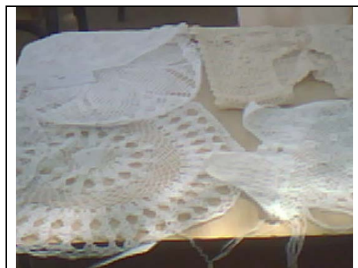
Muestra de tejido.