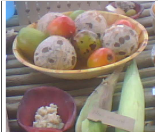
Muestra culinaria del territorio.