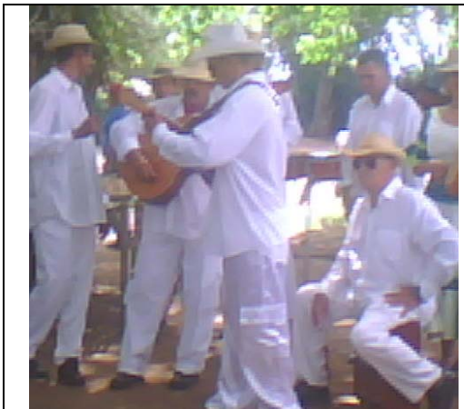
Grupo Portador Raíces Soneras.