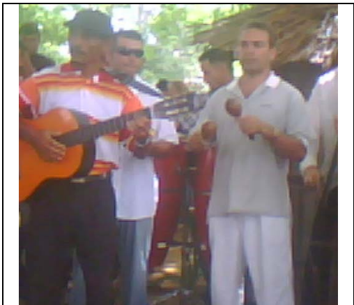
Grupo de aficionados Tiempo.