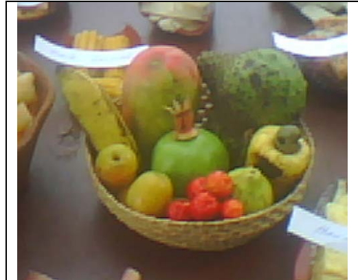
Muestra culinaria del territorio.