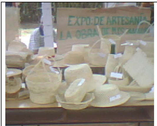
Empleo del Yarey.