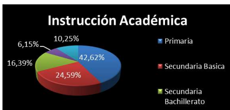
Figura 1. Nivel de Instrucción Académica

Análisis.- Se puede evidenciar que alrededor del 25% de los jefes de hogar encuestados en la Parroquia La Esperanza no poseen ninguna instrucción académica, y un 42,62% posee instrucción primaria; lo que no indica que aproximadamente el 33% ha tenido presencia en institutos de educación superior y de secundaria. Por lo que claramente se puede apreciar que el problema educativo es influyente y se desencadena generando problemas sociales.