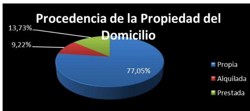
Figura 2 Procedencia de la propiedad del domicilio

Análisis.- Esta pregunta surgió como duda acerca de la procedencia de los domicilios de los encuestados en donde cerca de un 77% posee vivienda propia, un 10% están en una casa que es alquilada por amigos y compañeros; y también hay que mencionar que existe alrededor de un 13% están actualmente en viviendas que son prestada por familiares.