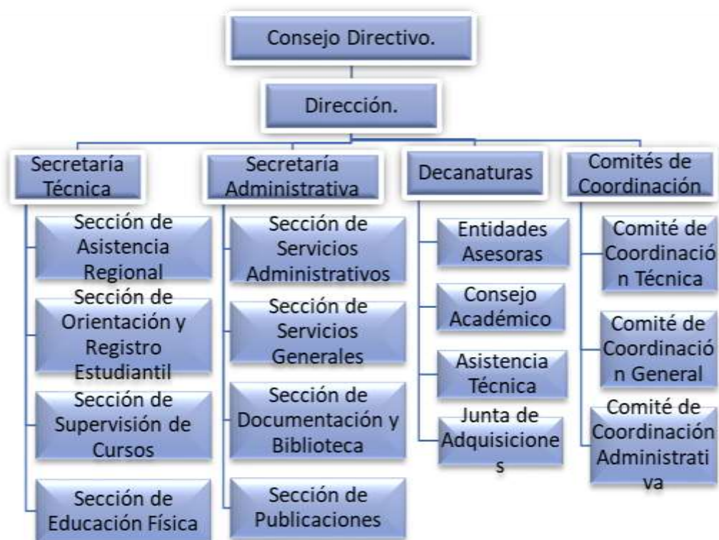
Gráfico 1. Organigrama ESAP