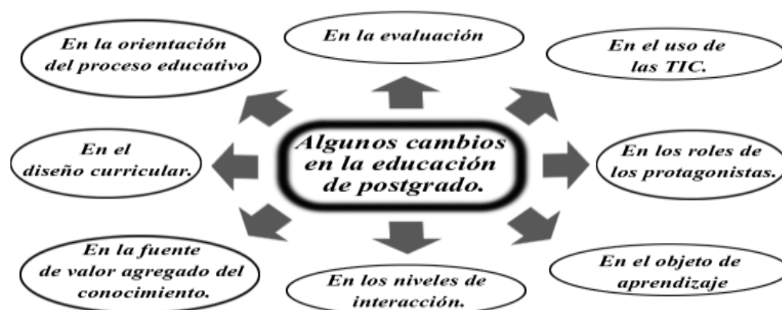
Figura 1.4 Algunos cambios en la educación de postgrado.

Algunos cambios que debe realizar la enseñanza postgraduada se presentan en la siguiente figura: