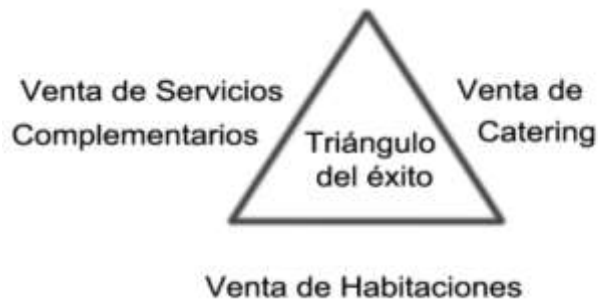
Figura 1.8 Triángulo de éxito en el sector hotelero.