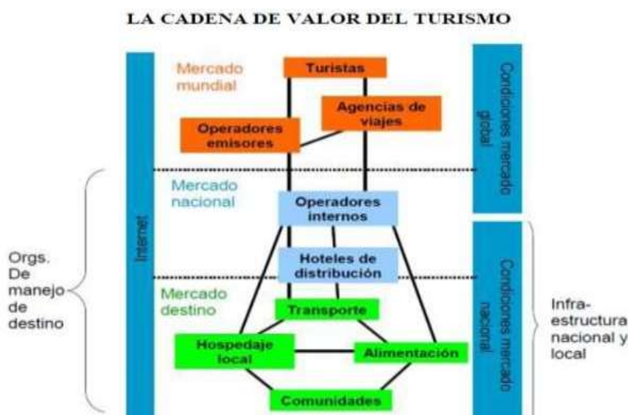
Figura 1. Cadena de valor del turismo

Referido a la cadena de valor del turismo, no es más que el conjunto de actividades interrelacionadas que se desarrollan en el mismo y que añaden valor a la experiencia turística. Involucra a los proveedores de todos los productos y servicios que forman parte de la experiencia del turista, a tenor de (Irigoyen, 2008:56). “Es todo lo que le pasa al turista desde que empieza a planificar su viaje hasta que regresa a casa” Los agentes de viaje, afirma (FORETUR, 2008), son “el conjunto de personas, empresas, organizaciones que de forma activa en las relaciones políticas, económicas, sociales y culturales del mercado turístico”.