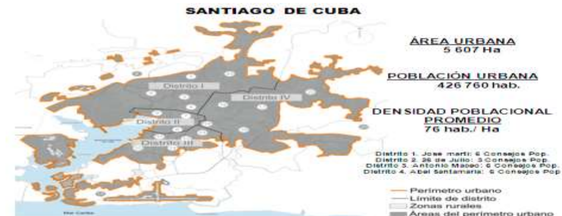
Población residente en Santiago de Cuba, sexo y relación de masculinidad (ONEI, 2015)

El comportamiento de la migración es ilustrado a través de los siguientes datos: