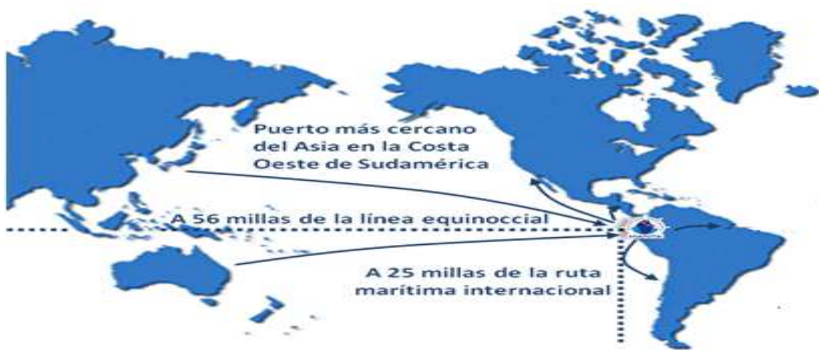
Gráfica N° 4

El Ecuador se encuentra en una ubicación geográfica estratégica por tener el puerto más cercano del Asia en la Costa Oeste de Sudamérica en relación a los países de América del Sur, lo cual le da una ventaja sobre los demás, miembros del APEC (Perú, Chile); como se muestra en la siguiente gráfica diseñada por la autoridad portuaria del Ecuador: