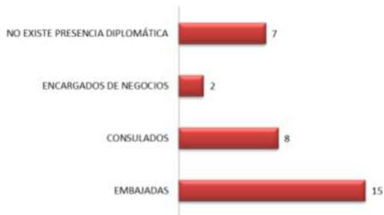
Gráfica N° 3

En esta misma línea, el Estado Ecuatoriano, ante las economías miembros del APEC tiene una ventaja competitiva porque ha establecido una vasta red de relaciones políticas, económicas, sociales y culturales, como se esquematiza en el siguiente cuadro la presencia diplomática.