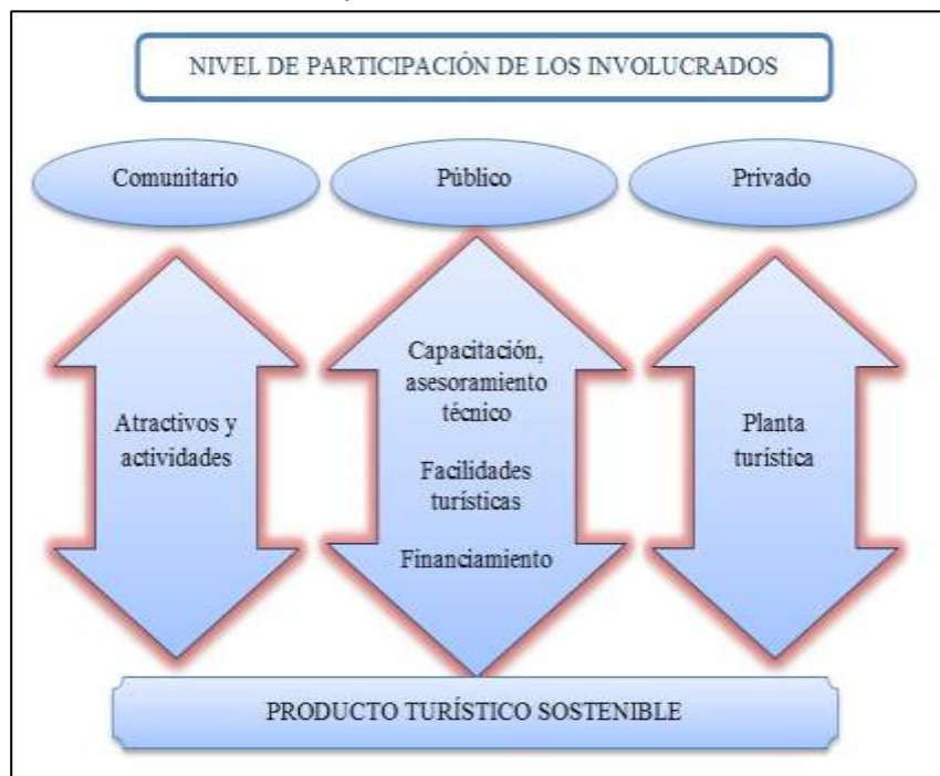
Figura 1 Participación de los involucrados