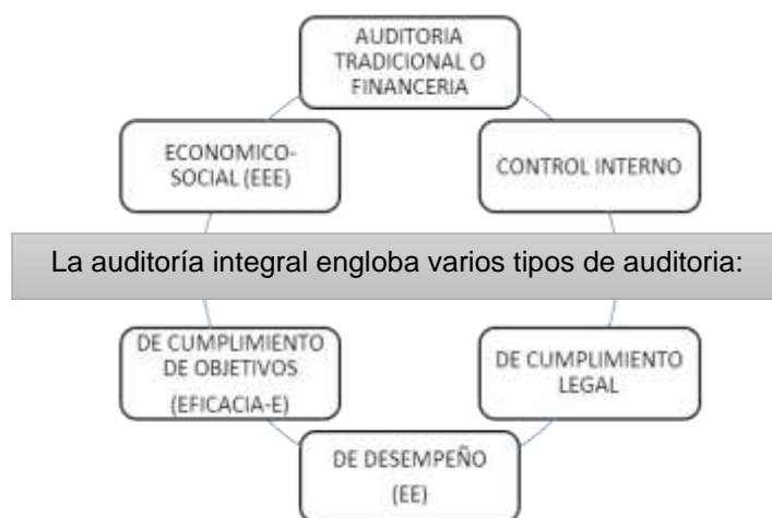
Ilustración 3 Tipos de Auditoría relacionada a la auditoría integral