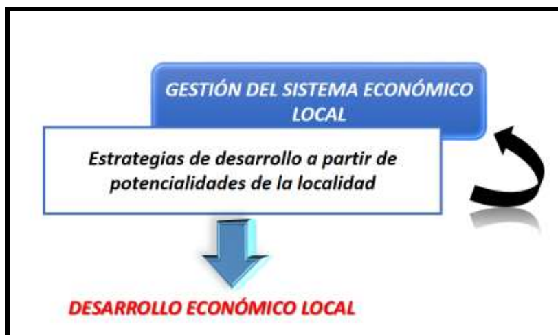
Figura 1: Interrelación conceptual

Tal como define la Organización internacional del trabajo (OIT), el Desarrollo Económico Local es un proceso de desarrollo participativo que fomenta los acuerdos de colaboración entre los principales actores públicos y privados de un territorio, posibilitando el diseño y la puesta en práctica de una estrategia de desarrollo común a base de aprovechar los recursos y ventajas competitivas locales en el contexto global, con el objetivo final de crear empleo decente y estimular la actividad económica. El desarrollo económico depende esencialmente de la capacidad para introducir innovaciones al interior de la base productiva y tejido empresarial de un territorio.