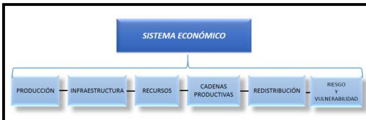
Figura 3: Estructura del sistema económico de los GAD

El sistema económico en los GAD está relacionado con los factores vinculados con el desarrollo de la economía de la parroquia, las opciones o potencialidades que pueden aprovecharse en función de la actividad productiva, el equipamiento de transformación y comercialización, con la situación económica específica del país, la provincia y el cantón. Que se muestran en la estructura del sistema económico de los Gobiernos autónomos en: producción, infraestructura, recursos, cadenas productivas, redistribución, riesgo y vulnerabilidad. (Figura 3)