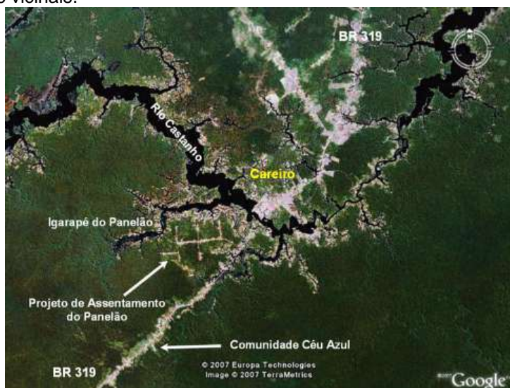
Figura 1 - localização do PA Panelão - Careiro - AM

O projeto de assentamento Panelão, criado em 1998, com 260 lotes/famílias, possui 3% da população do município de Careiro Castanho, ocupando uma área de 3.633,25 hectares, e atualmente possui 251 famílias assentadas (INCRA, 2015). Está localizado na BR-319 (Manaus – Porto Velho), no Km 117, a 3 km do centro da sede da cidade. O PA possui 9 km de ramais e 6 vicinais.