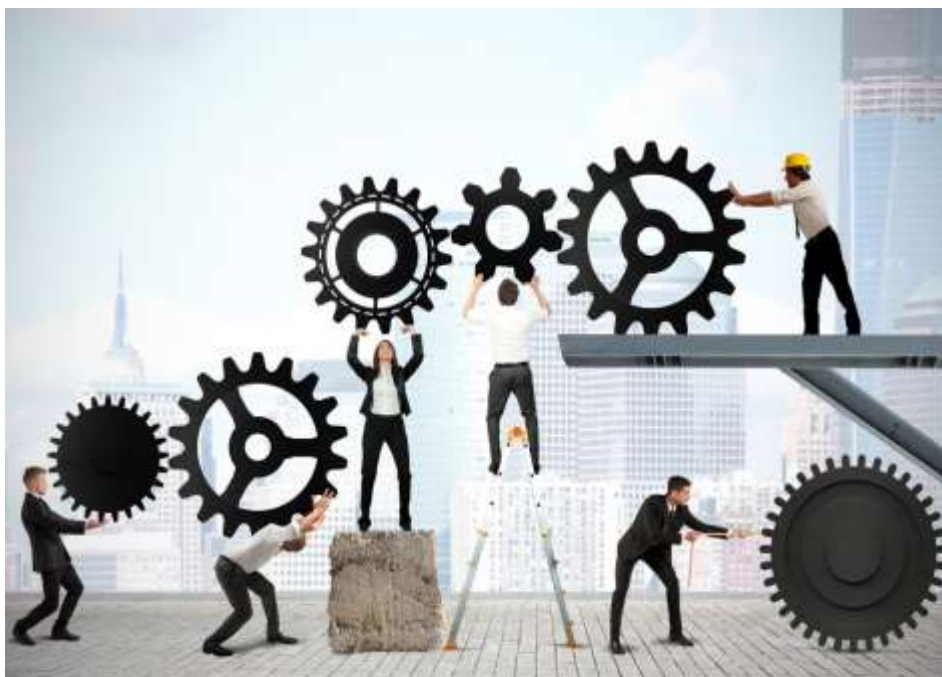
Ilustración 1 Liderazgo