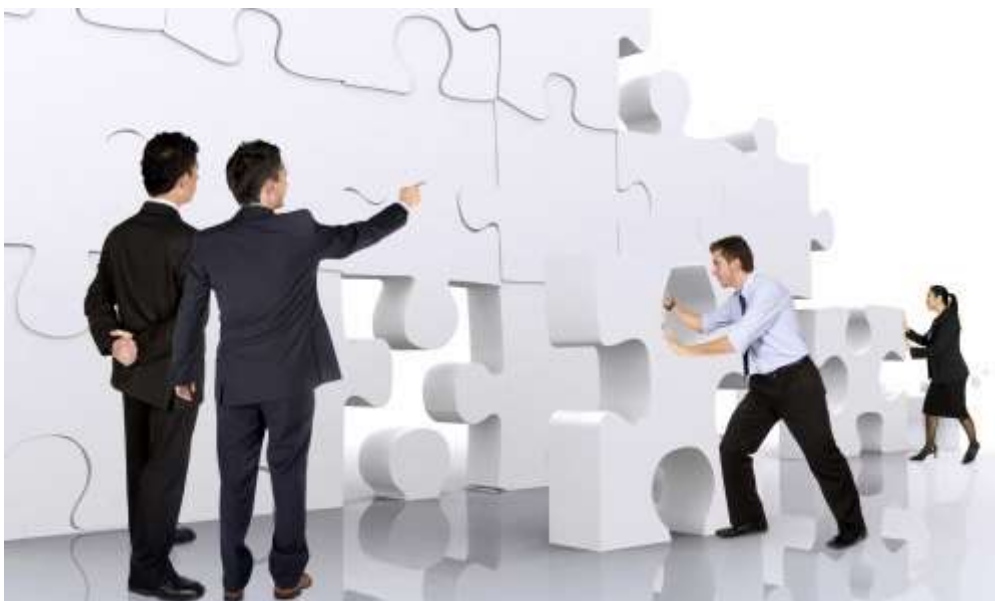
Ilustración 2 Jefe