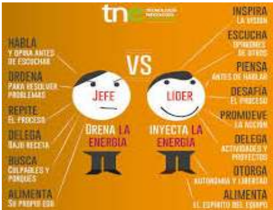
Ilustración 3 Diferencia entre Jefe vs Líder