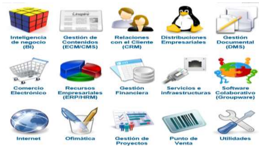
Ilustración 3 Negocios Inteligentes