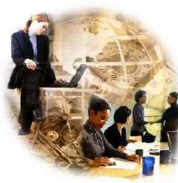
Ilustración 1 Negocios