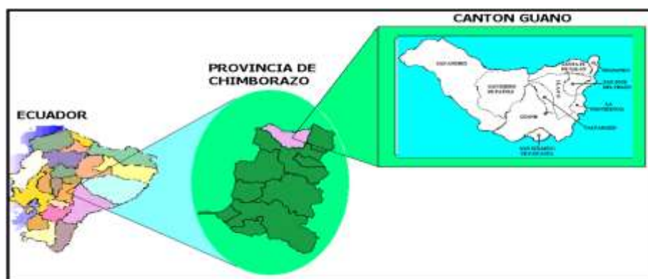
Figura 01 Ubicación Geográfica del Cantón Guano

Existe diversidad de pisos climáticos, desde el valle hasta la montaña más alta. Por lo mismo, hay vegetación de toda clase, incluyendo la propia de los páramos y su rango de altitud va desde los 2.000 hasta los 6.310 metros sobre el nivel del mar (msnm), en su jurisdicción se encuentra ubicado el Nevado Chimborazo. Es un importante centro artesanal de tejido de lana. Su especialidad es la elaboración de alfombras, se encuentra al norte de la provincia, por lo que limita con Tungurahua, al sur y al Oeste limita con el Cantón Riobamba y una pequeña parte de la Provincia de Bolívar y al este con el río Chambo.