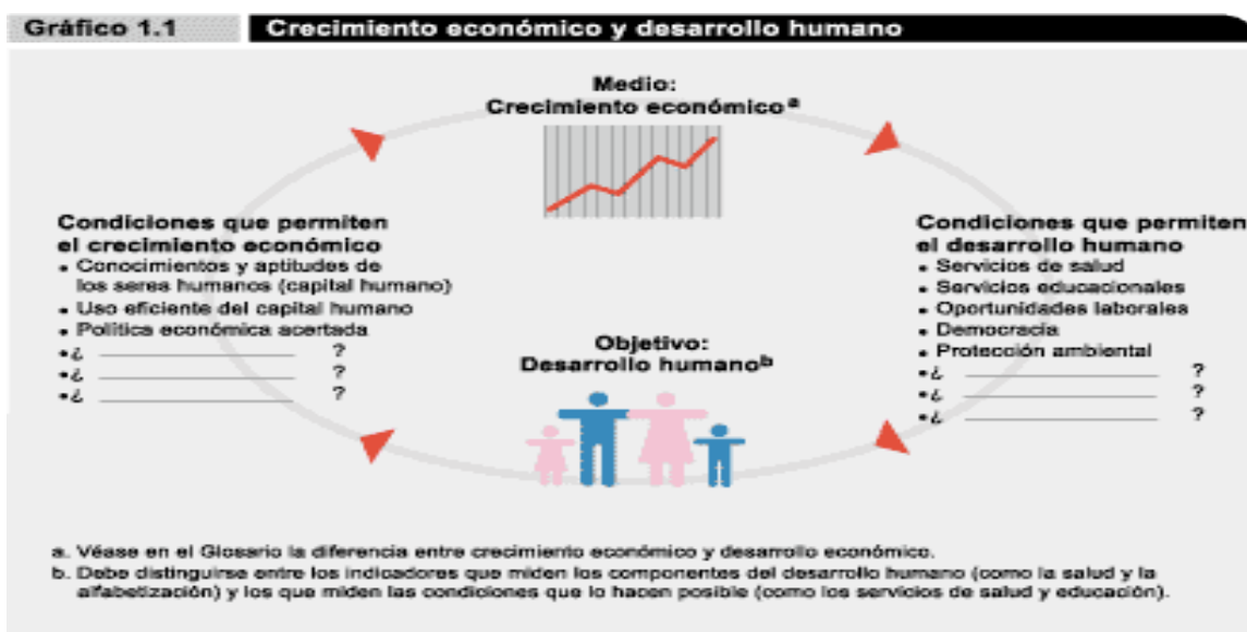
Ilustración 2 Crecimiento económico y desarrollo humano.