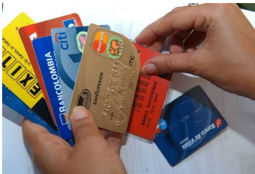
Ilustración 2 Tarjetas de crédito