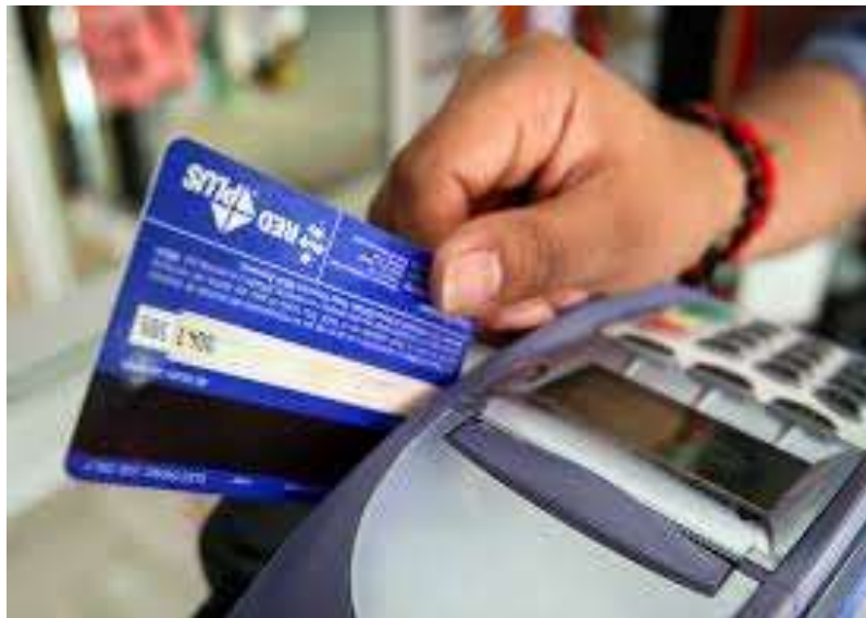
Ilustración 4 Pagos con tarjeta