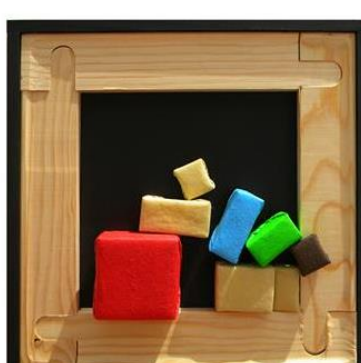
Amorfoformas. Serie Amorfas 263, 265, mixta textil, 24.5 x 29 x 6 cm/u