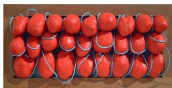
Serie Amorfás 166, 165, 164, mixta textil 20.5 x 42.5 x 7 cm /u