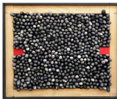
Serie Amorfás 25, mixta textil, 56 x 68 x 3 cm