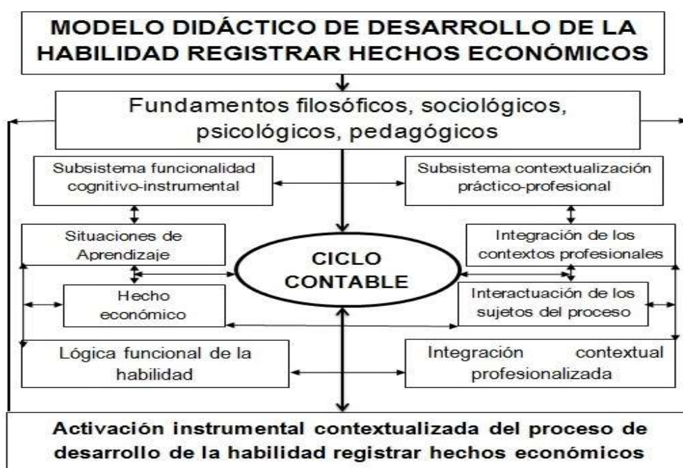
Figura 2.3: Modelo Didáctico de Desarrollo de la Habilidad Registrar Hechos Económicos

La activación instrumental contextualizada del proceso de desarrollo de la habilidad registrar hechos económicos constituye un conjunto de pasos que tiene como elemento activador contextual profesionalizado al ciclo contable en el cual se profesionalizan las acciones y operaciones que se dan en el contexto de la entidad laboral, con un carácter desarrollador, sistémico e integrador, de manera que respondan a hechos económicos reales en cada paso del ciclo contable, lo cual posibilita la unidad e integralidad de los conocimientos y habilidades profesionales que el estudiante se apropia durante su formación en el contexto de la escuela.