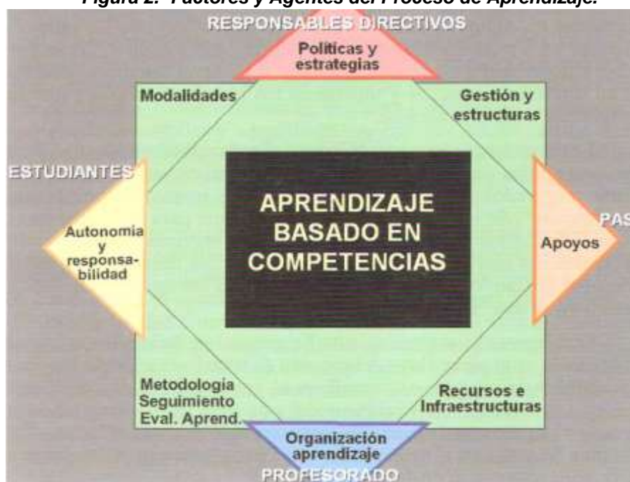
Figura 2.- Factores y Agentes del Proceso de Aprendizaje.

En la figura 2 se muestran los factores y agentes intervinientes en el proceso de enseñanza-aprendizaje