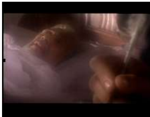
Figura 3. El joven escribano.

El joven es iniciado en el arte de escribir con métodos rígidos y estrictas normas católicas. Tras años de práctica llega a captar la atención de sus maestros por la pulcritud de su trabajo al punto de perfilarse como el mejor del grupo y el único relevo como testador del obispo. “Para el joven escribano ser elegido como testador del obispo implica la cúspide de un recorrido... Para este cargo hay que tener un dominio en la escritura de cualquier documento (incluyendo testamento) en cuanto a estructura formal y aspectos legales” (Peña y Peña, 2014: 18)