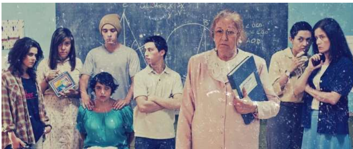
Figura 2. Desastres naturales.

Al recorrer las instalaciones de la escuela, identifica actos que no deben ocurrir si está cerca un maestro experimentado. La invocación por la disciplina y el respeto entre los niños son pues una de las demandas por atender.