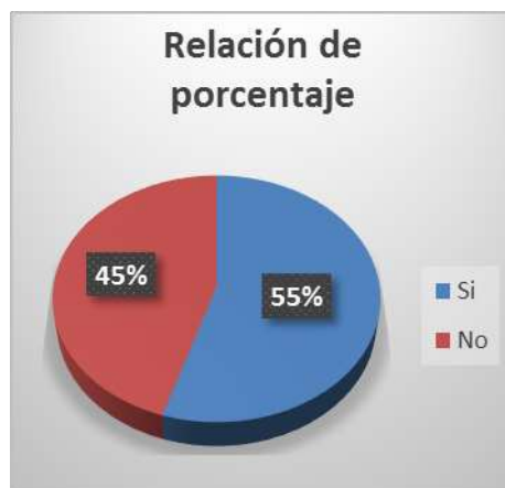
Figura 2: Porcentaje de Pregunta uno