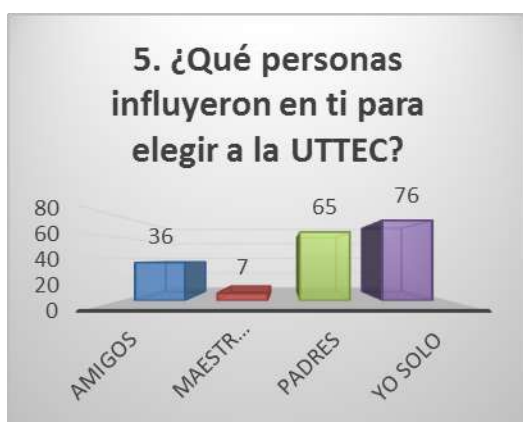
Figura 6: Pregunta cinco

Sería conveniente que durante su proceso de adaptación a la vida universitaria, se le fomentará el sentido de pertenencia haciéndole partícipe de actividades culturales, deportivas y académicas, aunado el interés por el cuidado del lugar físico, el medio ambiente esto podría ayudar a desarrollar habilidades y aptitudes que faciliten a evitar la apatía y/o el abandono por los estudios.