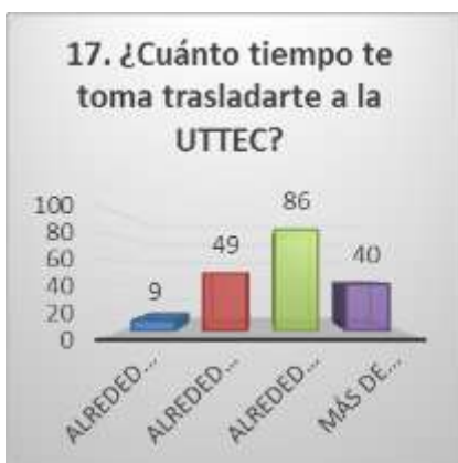
Figura 8: Pregunta Diecisiete

Cuando esta decisión debería ser al cien por ciento del estudiante, los padres influyen de una manera considerable, cuando la opinión familiar se contradice con los propios deseos y la vocación del joven, surgen problemas de enfrentamiento y disputas. En cualquier caso, es importante saber las consecuencias a futuro la frustración y el abandono escolar.