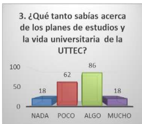
Figura 3: Pregunta tres

El 55% de los alumnos la definen como un servicio que ayuda e informa en la elección de su carrera profesional. Otro sector de los encuestados relacionan a la orientación vocacional con su proyecto de vida ya que los orienta en conocer sobre lo que van a ser a futuro y conocerse más uno mismo. En este sentido, vemos que los alumnos relacionan en primer lugar la orientación vocacional como la elección de opciones educativas, para otros tiene relación con la formación de un proyecto de vida, lo cual nos indica que la orientación si tiene presencia en la escuela y está siendo tomada en cuenta por los alumnos, aunque falta hacer el énfasis de los objetivos que persigue, sobre todo porque hay un 45% en porcentaje que no tuvo orientación vocacional y dentro del mismo algunos no contestaron y cabría preguntarse qué es lo que está pasando con estos jóvenes. Se observa entonces una necesidad de que los alumnos conozcan las diferentes alternativas de educación para que elijan de acuerdo a sus intereses y que se mantengan conscientes de la posibilidad de ser asignados a otra que no sea la primera y con ello verse en un contexto escolar que desconocen.