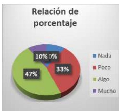
Figura 4: Porcentaje de Pregunta tres

Cabe preguntarse por qué aspectos como el clima institucional, el acoplamiento, la integración social, los planes y programa de estudio tienen un papel importante en el caso de la UTTEC, y los alumnos difieren indiferencia y en algunos casos tienen un total desconocimiento de la normatividad de la institución donde realizan sus estudios.