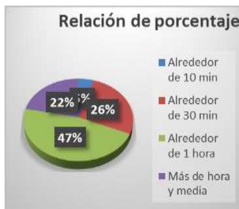
Figura 7: Porcentaje de pregunta

Otros factores que influye para que un estudiante abandone su carrera universitaria son el lugar de donde reside, los ingresos familiares e incluso la inseguridad que se vive, La