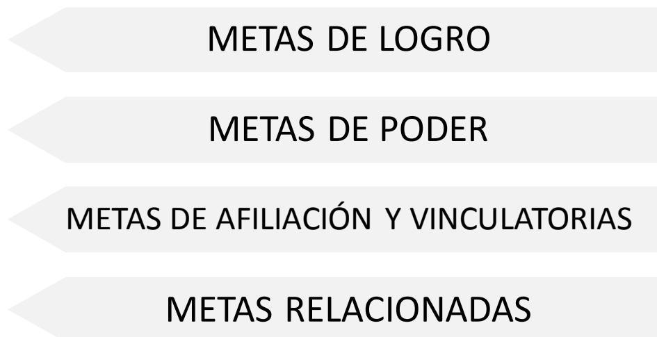
Figura 1. Categorías de motivación intrínseca del estudiante

Hay una infinidad de motivaciones en el estudiante para salir adelante, así también se encuentran casos de marcada falta de interés por la superación, debido al entorno en que se encuentran y por la falta de una base formativa previa, en su vida estudiantil infante y adolescente. Además de las formas tradicionales de motivación, el incursionar desde los primeros niveles de estudio en proyectos científicos y colaborando activamente en estos, hace que el estudiante se interese y fomente en sí mismo la investigación y la auto preparación, sin olvidar que esto creara motivación extra por la orientación al logro, además de la satisfacción personal por superación y conocimientos nuevos. “Participación en investigaciones desarrolla el creatividad en diversas formas de actividad profesional, inspira a profundizar conocimientos, formas de habilidades analíticas, pronósticos y comunicativos, así como las características personales y profesionales”(Martyushev, Sinogina, & Sheremetyeva, 2015, p.265).