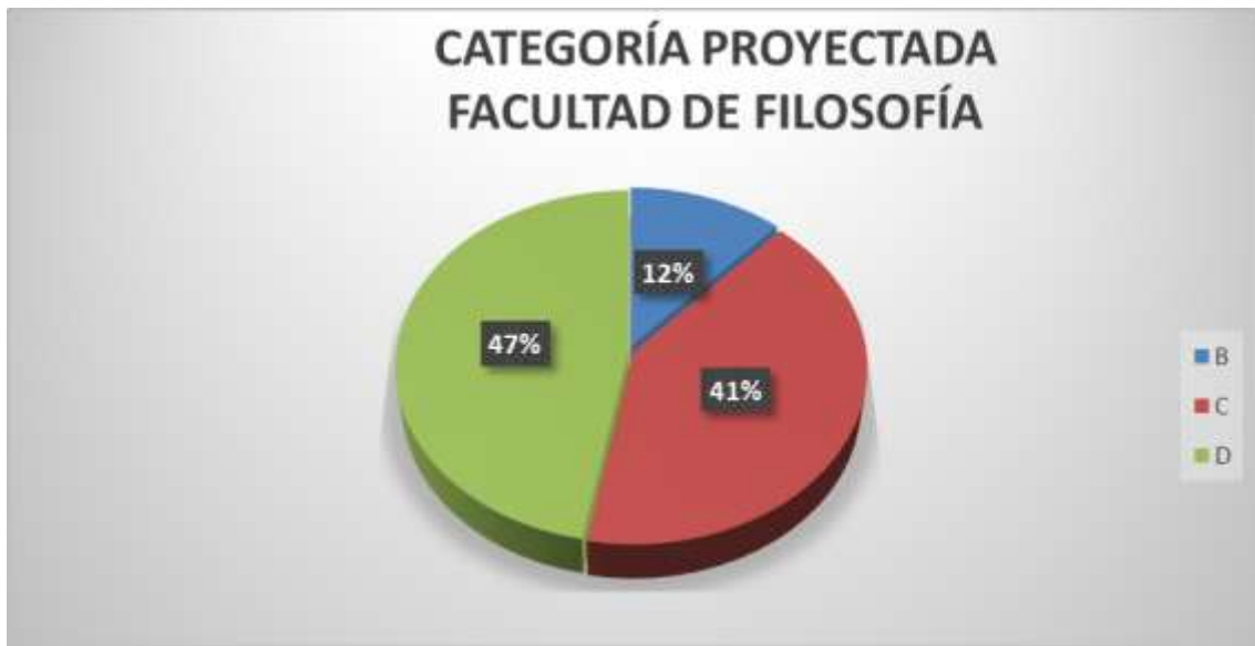
Gráfico # 3

FUENTE: HOJAS DE RUTA DE CADA CARRERA ELABORADO POR: Mg. Lilian Reza