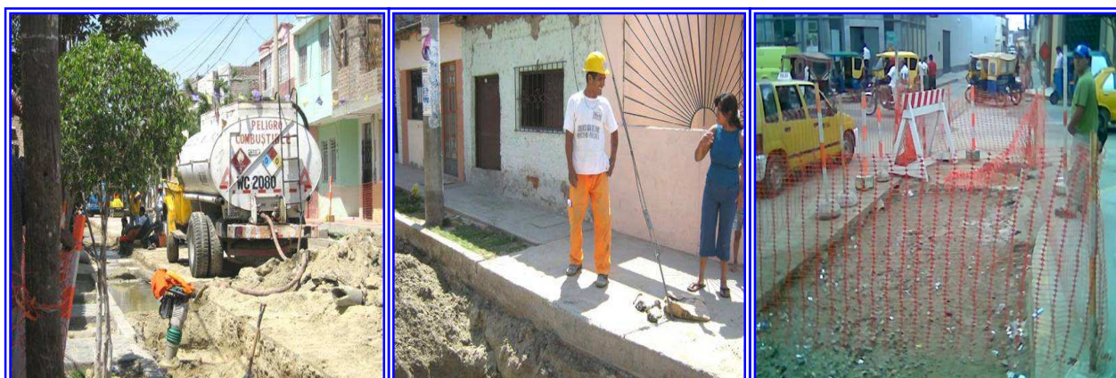
Fig. N° 16