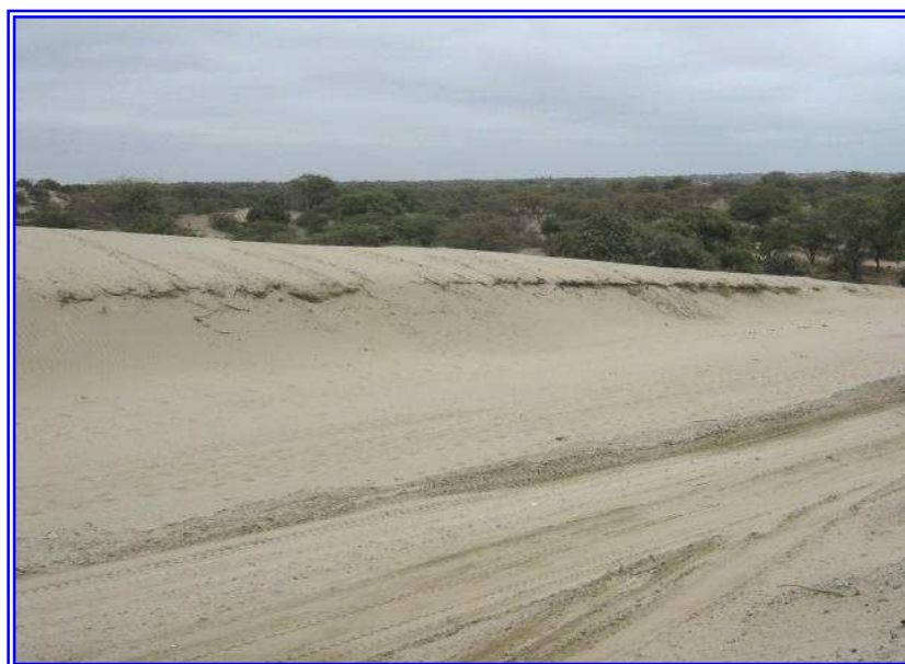
Fig. N° 10