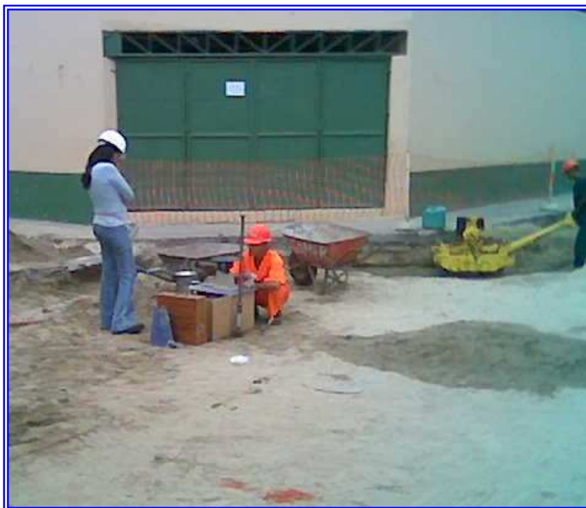
Fig. Nº 07