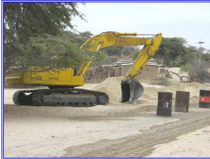
Fig. N° 05

Actividades en construcción de obras de agua potable