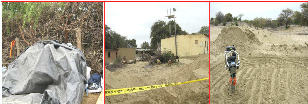
Fig. N° 15