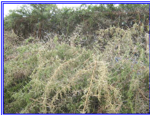
Flora: Arbusto Faique