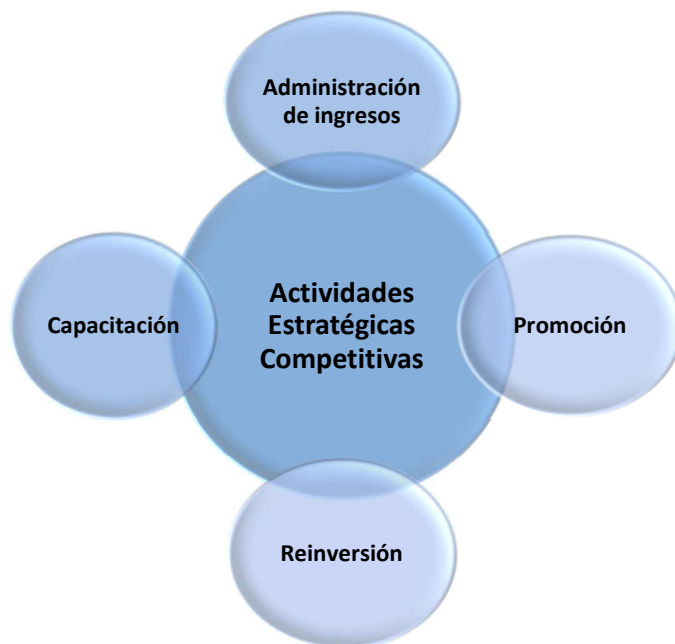
Gráfico 2. Actividades estratégicas competitivas- Turismo rural.

Analizando los datos proporcionados de ingresos económicos del acontecimiento natural, se determinó que en promedio anualmente el evento deja un ingreso directo estimado de USD $150.960,00 suma que constituye un valor monetario sumamente importante para las necesidades de los pobladores. Que reciben un promedio de 4.440 turistas y que por lo general el evento tiene una duración de 4 días.