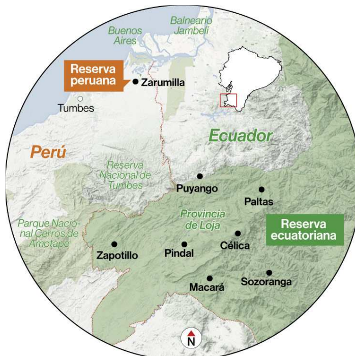
Figura 1. Cantones de Loja dentro del bosque seco