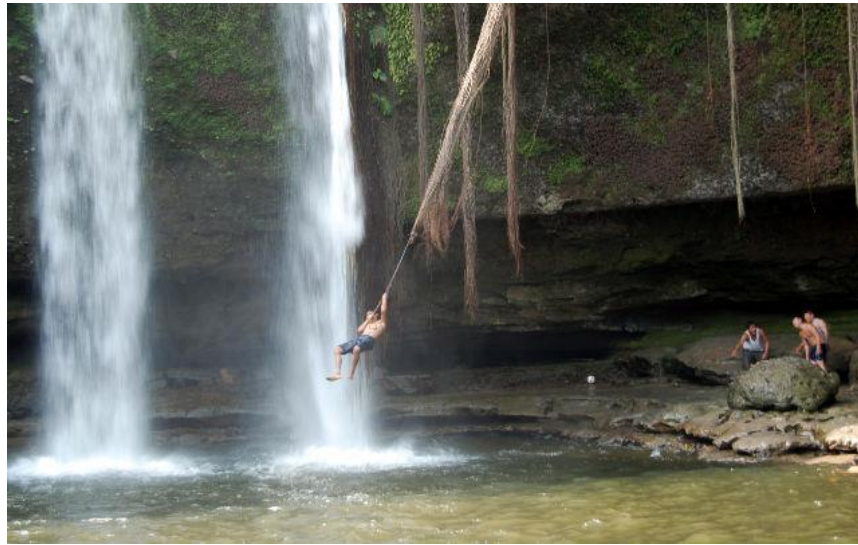
CASCADA DEL ARMADILLO

Se detalla a continuación algunos de los lugares turísticos que pueden ser potenciados en El Carmen.