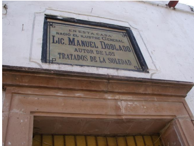
Placa alusiva al lugar de nacimiento del prócer