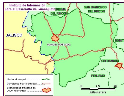
Imágenes de ubicación del pueblo. (Instituto de Información para el estado de Guanajuato. 2008 )

Por Cédula Real del 12 de agosto de 1532, se donan tierras al cacique purépecha Diego Tomas Quesuchiha, en los viejos dominios de los Huachichiles del Subgrupo otomiano. En un principio fue congregación llamada San Pedro Piedra Gorda, (1634). 8 Los otomíes fueron los primeros habitantes de esta región. El cerro de Chiquihuitillo, referencia emblemática del poblado, fue nombrado por estos. Fueron grandes artesanos; llegaron a trabajar el oro. A partir del año de 1568 se establecieron los españoles en el nombrado rancho de Santa Inés, bajo la autorización del Virrey Don Martín Enríquez de Almanza.