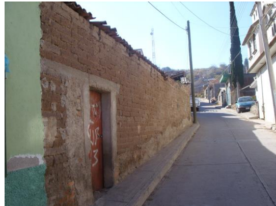
Imágenes de calles del pueblo