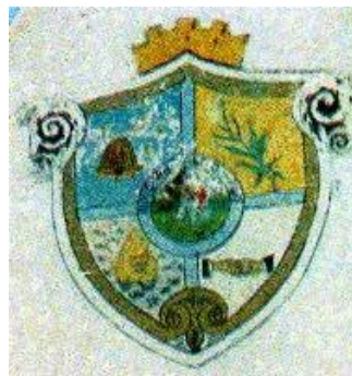
Escudo municipal 9