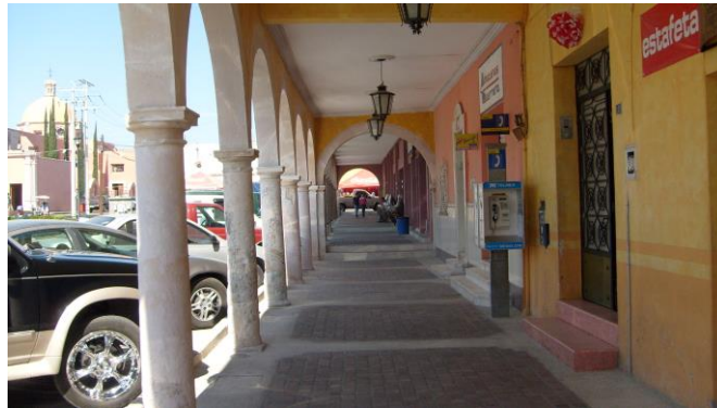
Portales comerciales frente al Jardín principal

participo el mismo en diferentes acciones apoyando al movimiento; vivencias que son una aportación muy importante a la historia local, regional y nacional; es un punto de vista diferente al oficial, pues los hechos que se narran nos encuentran consignados ningún otro texto” 19