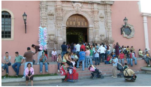
Frente iglesia del pueblo. Un domingo por la mañana

En el centro del poblado se consiguen las comodidades propias de la sociedad contemporánea. La modernización del pueblo es evidente con el cambio de la imagen urbana y la estructura urbana, donde los servicios son accesibles para los que viven en el núcleo central urbano y pueden pagar estos.