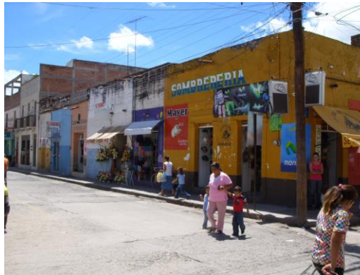
Calle al centro del municipio 5

Para la comprensión de la historia local es necesaria la metodología de la historia oral, donde las gentes de edad tienen elementos para la reconstrucción barrial del poblado y ofrecen elementos de construcción identitaria. Introducción