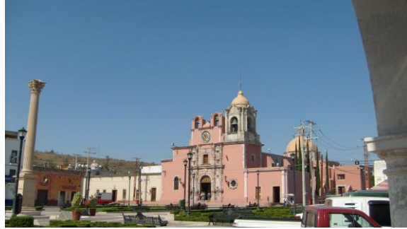
Panorámica de la iglesia y Jardín. Rre208