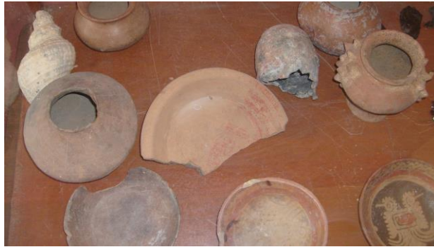
Tepalcates. Evidencias materiales de asentamientos ancestrales

Las fiestas tradicionales son de enorme importancia en el Estado. Hay fiestas que son muy interesantes, como la de San Felipe Torresmochas, que es muy pequeña pero la de San Miguel Arcángel es complicada en la cual las llamadas milicias de San Miguel son acompañados por tambores y bandas de guerra. Las pastorelas son populares y de impacto. Los juguetes son de barro. La madera en Celaya. 18