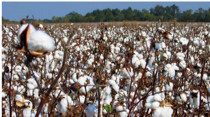
Foto No. 1 Los campos algodonderos del Valle de Juárez