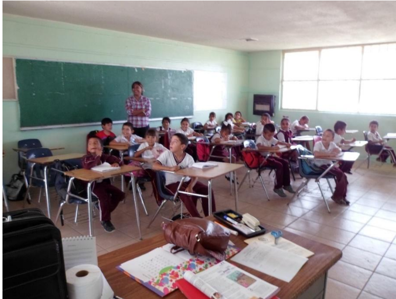
Foto No. 4 Salones de clase

En esta visita exploratoria cada integrante del equipo anotó en su libreta datos de las personas, lugares, pendientes y cosas o situaciones que debemos cuidar dentro de la intervención. De regreso a la universidad el equipo se reunió para comparar, cotejar e intercambiar notas, ya que la información de cada integrante puede ser de gran utilidad para otro, es por ello que la esta información debe socializarse.