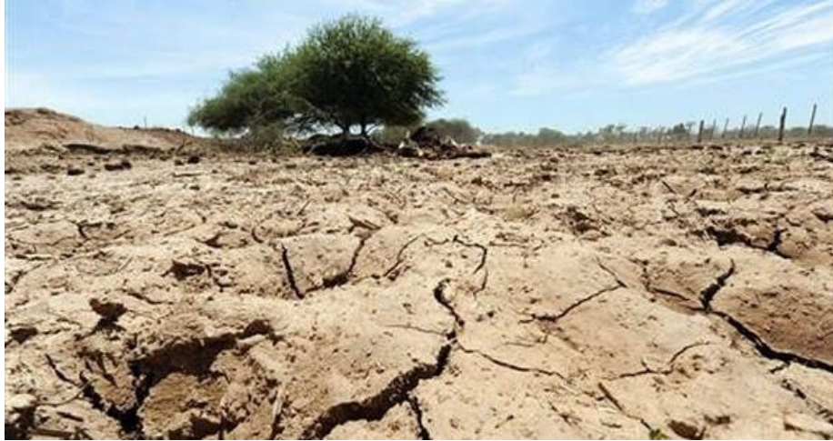
Foto No. 2 El Valle de Juárez en la actualidad

Fuente: https://3.bp.blogspot.com/-mGaFTpa7ym8/WFNeizGn_ol/AAAAAAAYbc/w0z0wIL_ZYU4A81z-rsiArq9hqVTKvGgACLcB/w1200-h630-p-nu/28.jpg