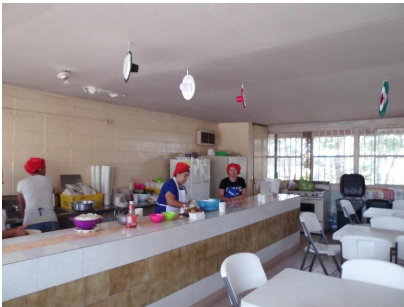
Foto No. 5 El comedor

planeación educativa, los materiales necesarios y un instrumento de evaluación de la intervención.