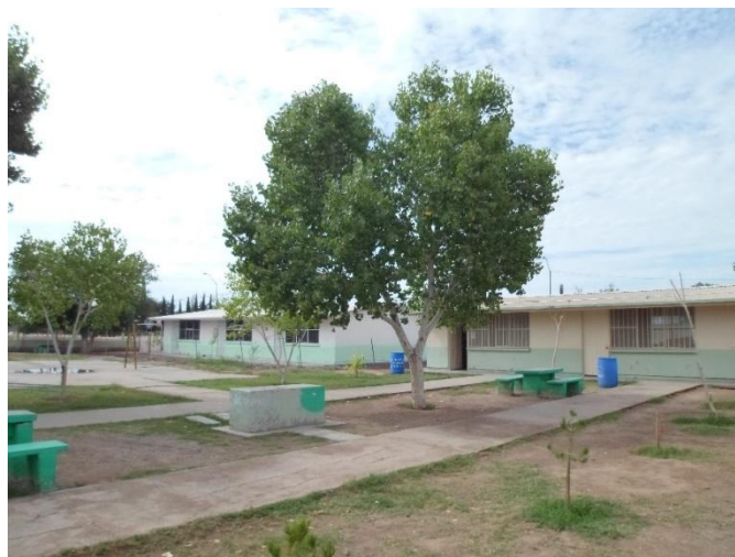
Foto No. 3 Las instalaciones de la Escuela Primaria

En cuanto a las instalaciones notamos una escuela bastante cuidada, limpia, los salones con mobiliario completo, no roto ni maltratado. Se podía ver en todos los salones que las maestras contaban con material de papelería y didáctico, suficiente y apropiado para realizar sus labores. Al profundizar en el tema, las maestras nos comentaron que gran parte de esto es gracias a ellas, que traen su propio material a la escuela y compran muchas de las cosas con las que trabajan.