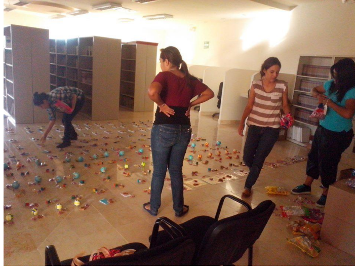
Foto No. 6 La organización del trabajo por los alumnos de la UACJ