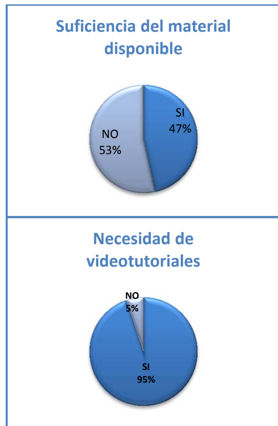
Gráfico 2. Demanda de más material de apoyo