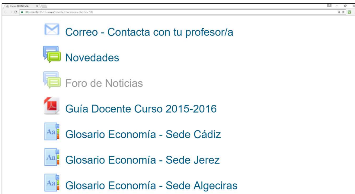
Figura 2. Vista del Campus Virtual de Economía.